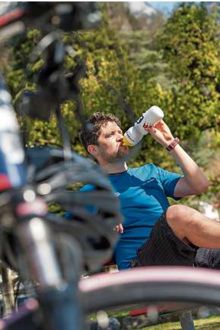
Zur ausgedehnten Velotour gehören auch erholsame Pausen.